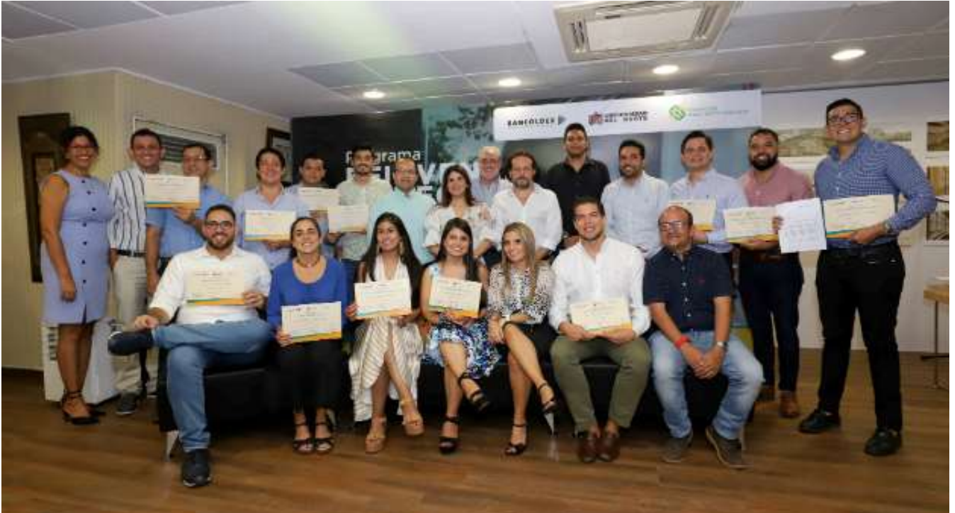
Empresarios graduados del programa 'Reinventar tu Negocio'.

Se realizó la clausura de la primera versión del programa de la Fundación Mario Santo Domingo, Bancoldex y la Escuela de Negocios de Uninorte.